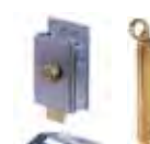
Accessori vari pagina <NI>