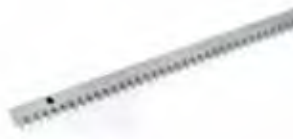
Cremagliera e catena Vedi a pagina 96