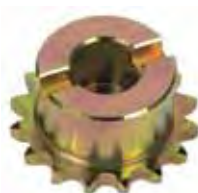
Pignone Z16 catena