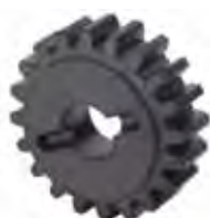
Pignone Z20 cremagliera