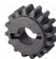
Pignone Z16 cremagliera