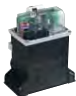
Scheda elettronica 780 D (incorporata nell'automatismo)