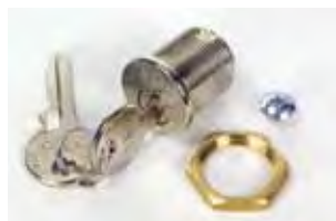
Serratura di sblocco con chiave personalizzata