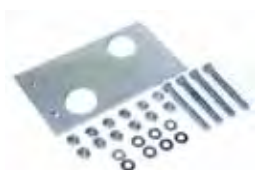
Piastra di fondazione con regolazioni laterali ed in altezza (confez. da 6 pz.)