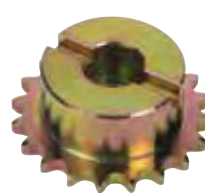
Pignone Z20 catena