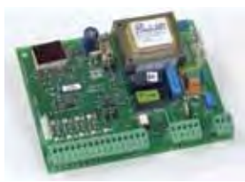
Scheda elettronica 578 D (installazione remota)