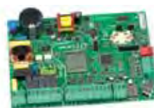
Scheda elettronica E145 (installazione remota)